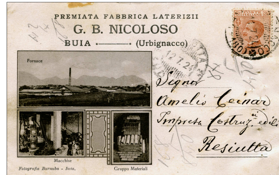
Fronte e Retro di una cartolina datata 1924 della Fornace Calligaro-Nicoloso. Una specie di fattura che fa anche da pubblicità alla ditta. Sul fronte le immagini della fornace e dei prodotti di questa.