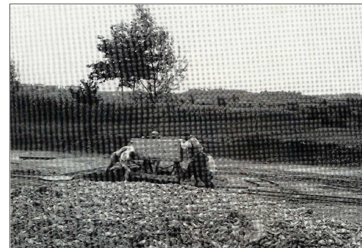
Fornace di Urbignacco, 1930 (forse). Operai spingono il carrello che trasporta l'argilla dalla ghave al zoc