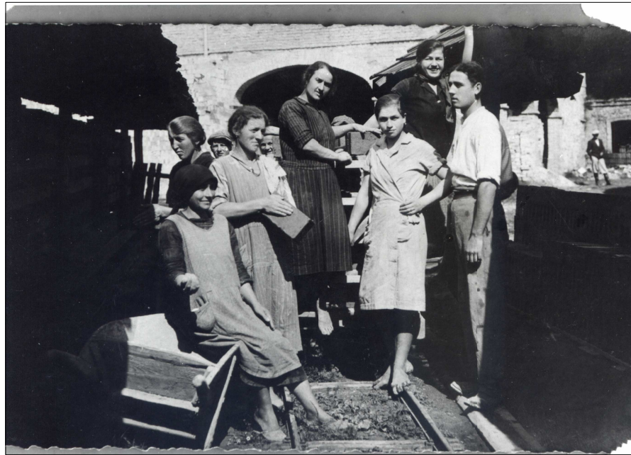
Gruppo di lavoro della fornace di Urbignacco.